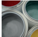
Ideale anche per decorazioni creative

SWARODIT® è la soluzione per tutte le vostre esigenze: segnaletica di salvagenti, guardrail, segnaletica catarifrangente in legno o pietra, come segnaletica di idranti o cantieri, utilizzabile in modo universale e versatile.