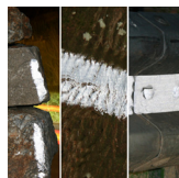
Colore catarifrangente resistente ideale per pietra, legno, metallo, ...