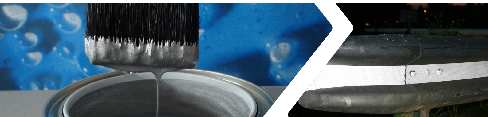
SWARODIT®: più sicurezza per automobilisti, ciclisti e pedoni